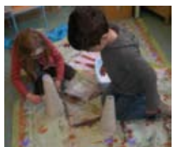
Le recouvrir de bandes plâtrées.